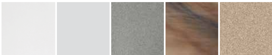
Alpinweiß Eisgrau Platin Toskanasonne Wüstensand

Die Wanne besteht aus einem glasfaserverstärkten Acrylmaterial für beständig gute Optik und optimale Widerstandsfähigkeit. Wählen Sie aus einem Farbsortiment von traditionell bis modern.