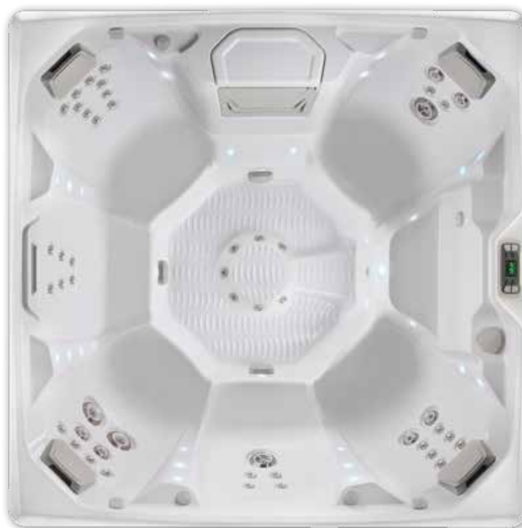
Pulse-Wanne in Alpine White abgebildet.