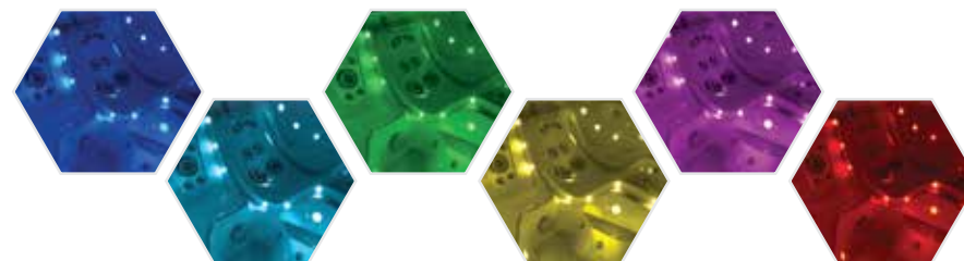
Auswahl aus sechs Farben in Edelsteintönen: Royal, Teal, Emerald, Gold, Plum oder Ruby.

Es gibt nichts Besseres als Außenbeleuchtung, um das richtige Ambiente zu schaffen. Erst wenn man die individuell anpassbaren LED-Leuchten der Whirlpools der Limelight® Collection persönlich erlebt, kann man sich von ihrer imposanten Wirkung überzeugen. Zwei Außenleuchten verlaufen entlang den vorderen Ecken des Whirlpools von oben nach unten und sorgen für einen optischen Effekt, der einen unvergleichlichen Eindruck hinterlässt. Dank verstellbarer Helligkeit und sechs Farboptionen kann die mehrfarbige LED-Beleuchtung so eingestellt werden, dass sie sich jeden Abend automatisch für vier Stunden einschaltet.