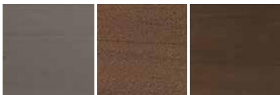
Grau Sandfarben Wenge

Wir waren die Ersten, die den Look einer geprägten Holzmaserung einsetzten, der heutzutage bei vielen Whirlpools zu finden ist. Die Außenverkleidung der Limelight® Collection besteht aus unserem exklusiven Everwood™-Material, das entwickelt wurde, um gutes Aussehen, geringen Pflegeaufwand und herausragende Haltbarkeit zu liefern. Wählen Sie zwischen drei Farben, die zu einer Vielfalt architektonischer Stile passen.