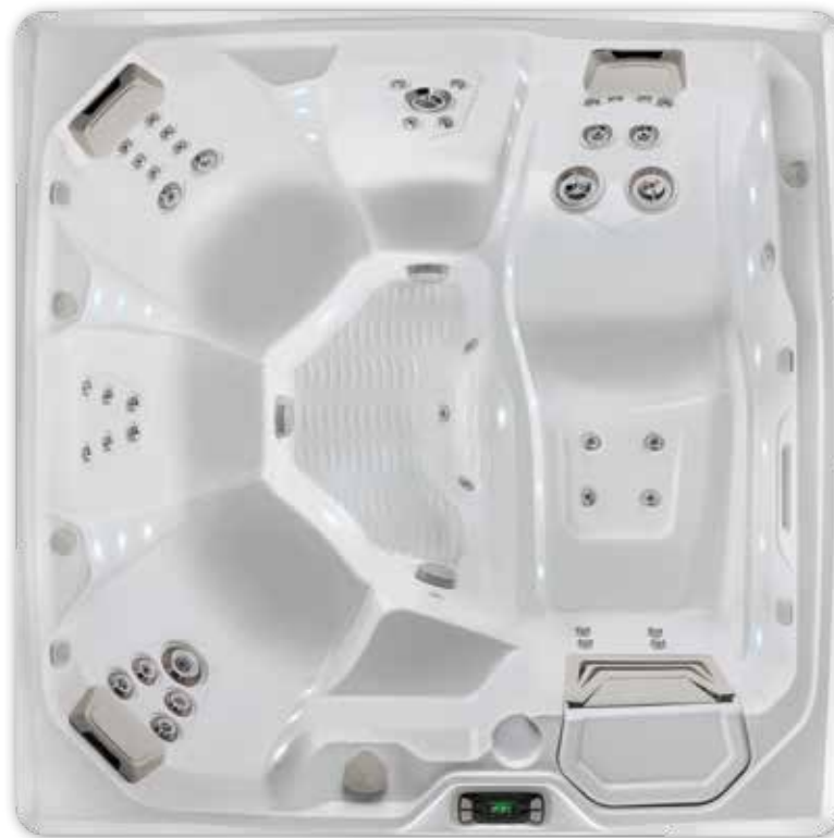
Flair-Wanne in Alpine White abgebildet.

Detaillierte Spezifikationen für den Flair sind auf Seite 36 zu finden.