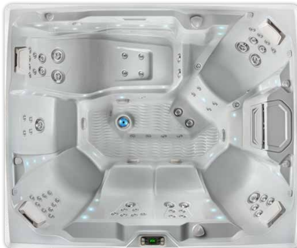
Prism-Wanne in Ice Grey abgebildet.