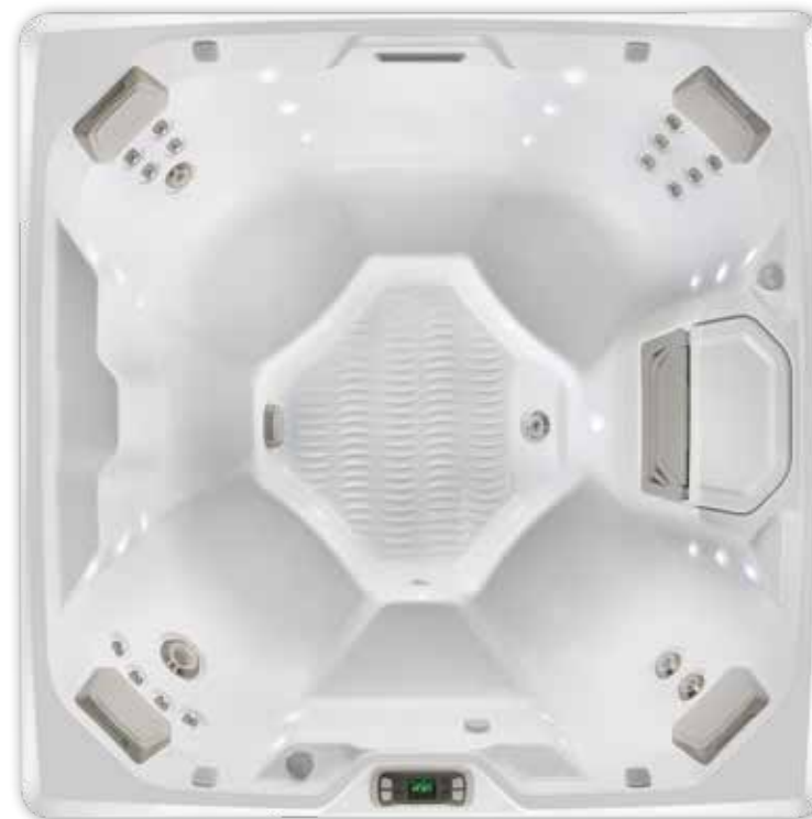
Beam-Wanne in Alpine White abgebildet.

Detaillierte Spezifikationen für den Beam sind auf Seite 36 zu finden.