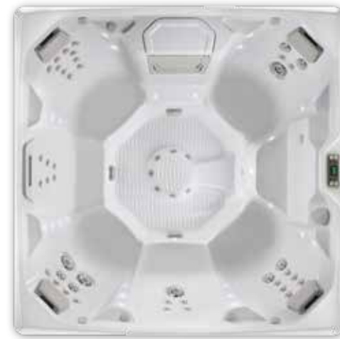
Pulse™ - 7 Sitze