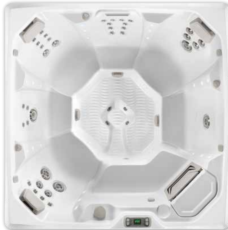
Flash-Wanne in Alpine White abgebildet.

Detaillierte Spezifikationen für den Flash sind auf Seite 36 zu finden.